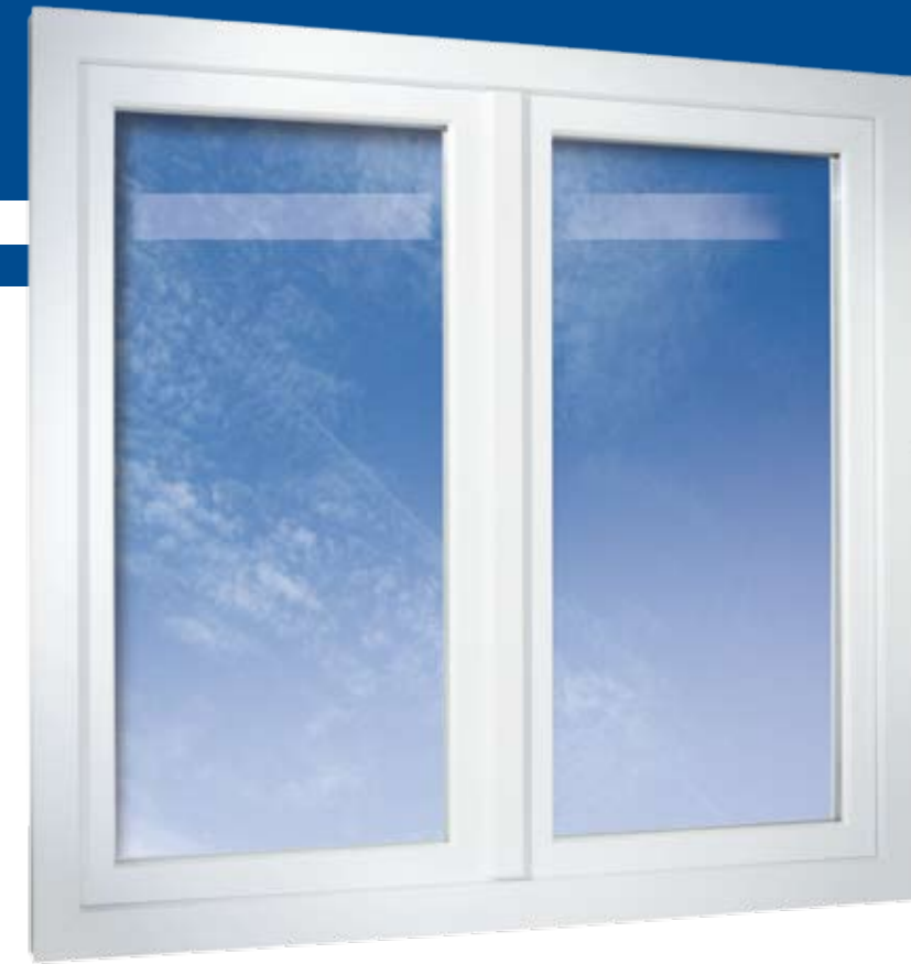
2-flügeliges Fenster flächenversetzt